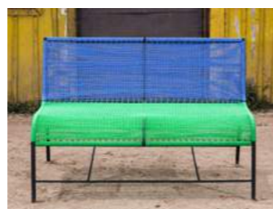
B/G Y/O W/B O/R L 120 x P 80 x H 80 x A 44 cm