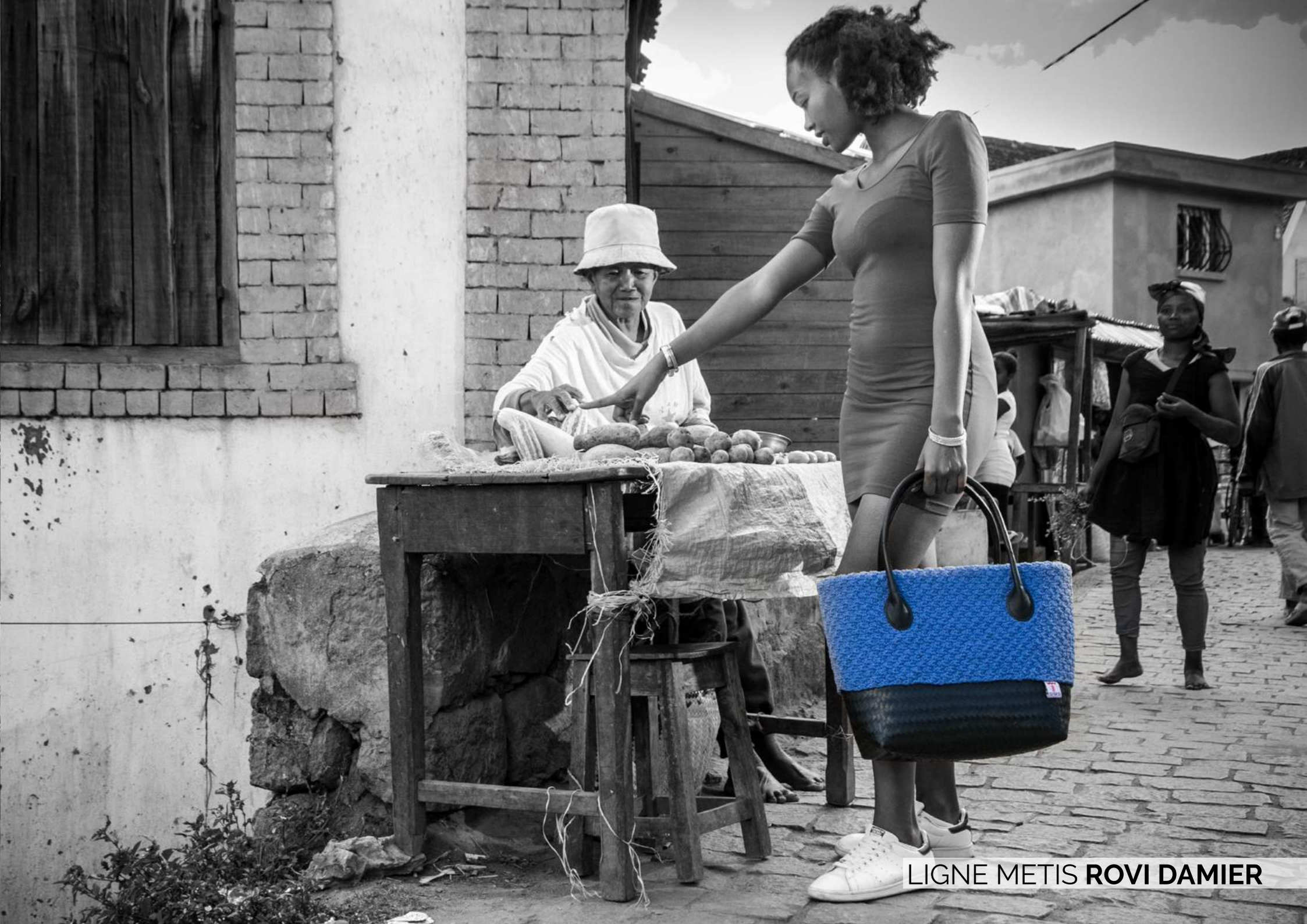
LIGNE METIS ROVI DAMIER