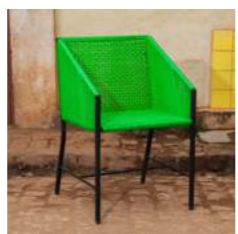
G L 54 x P 56 x H 85 x A 45 cm