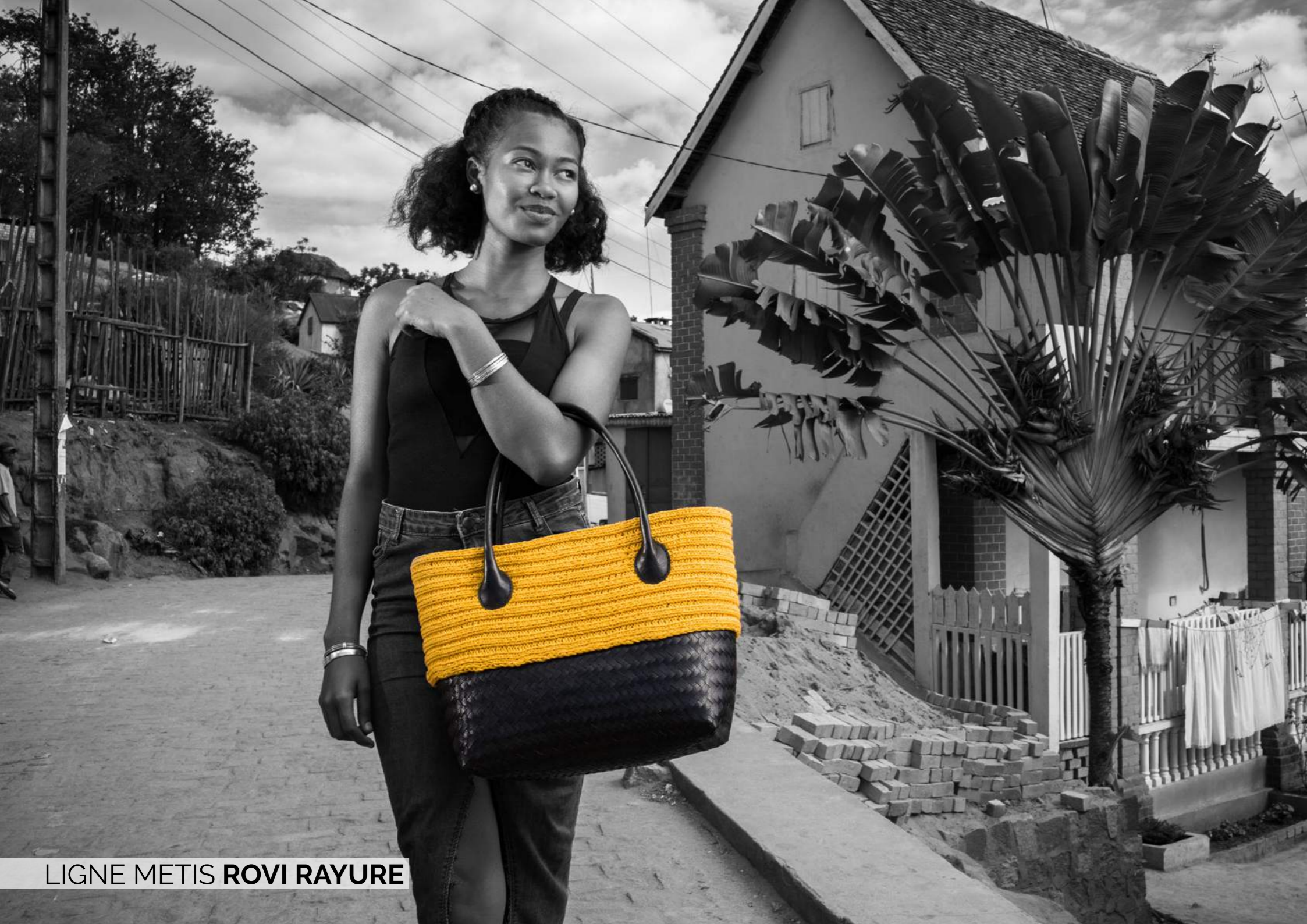
LIGNE METIS ROVI RAYURE