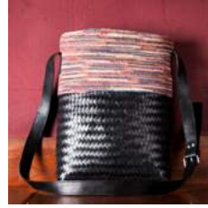
Mc L 31 x P 8 x H 36 cm