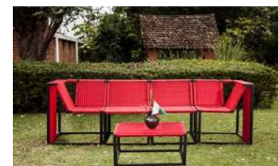
R O G B TOTAL L 266 x P 71 x H 82 x A 47 cm