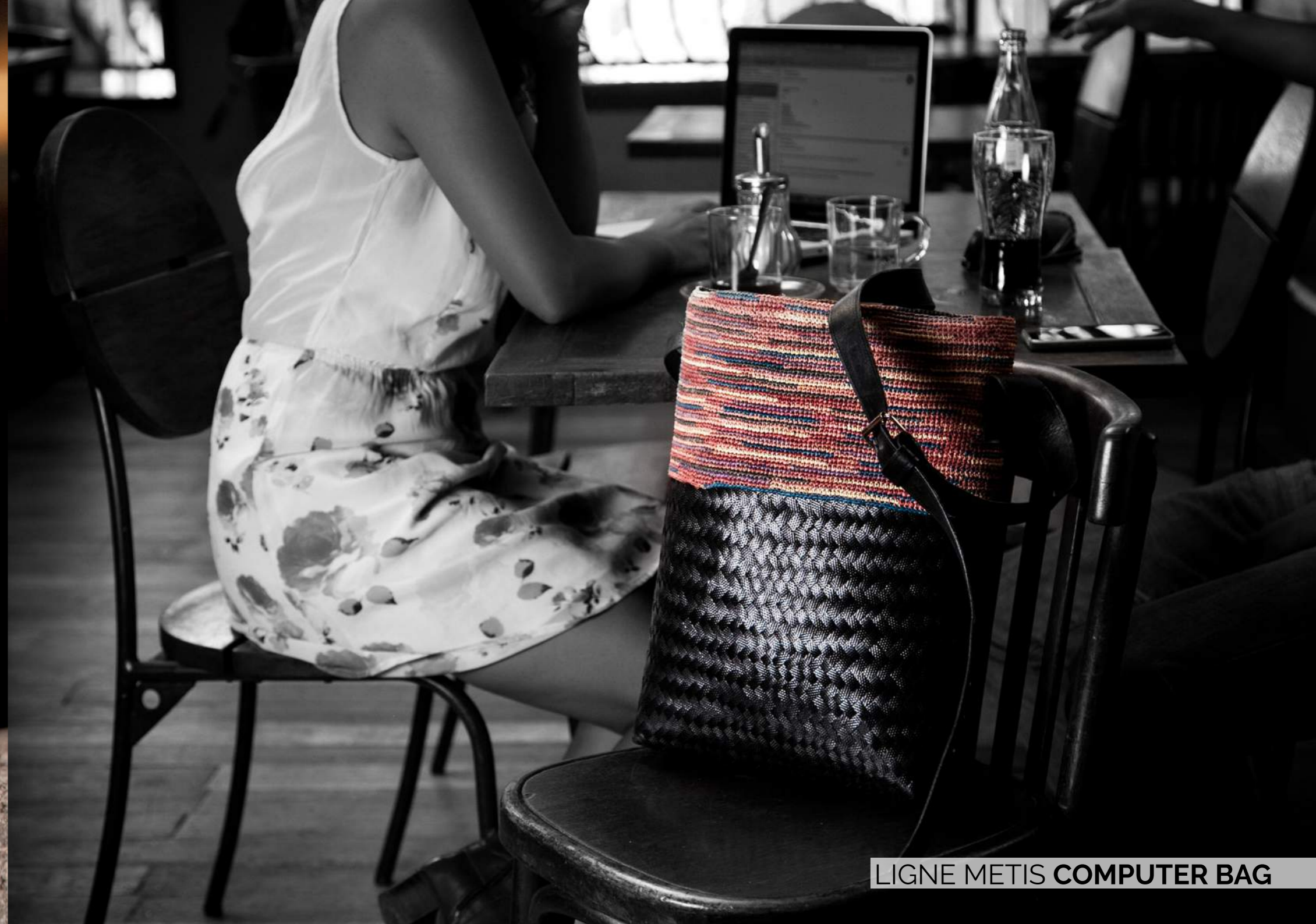
LIGNE METIS COMPUTER BAG