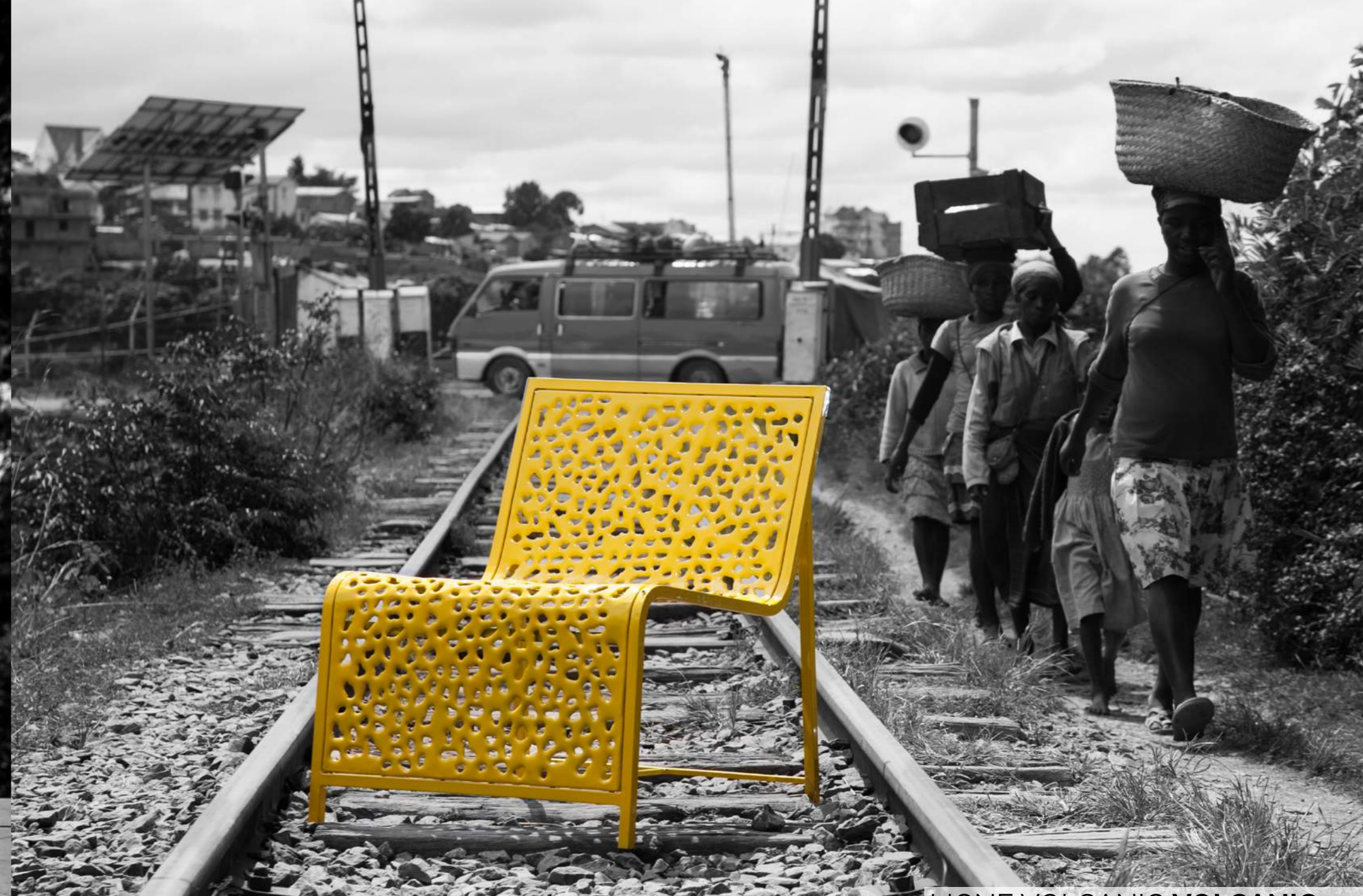
LIGNE VOLCANIC VOLCANIC