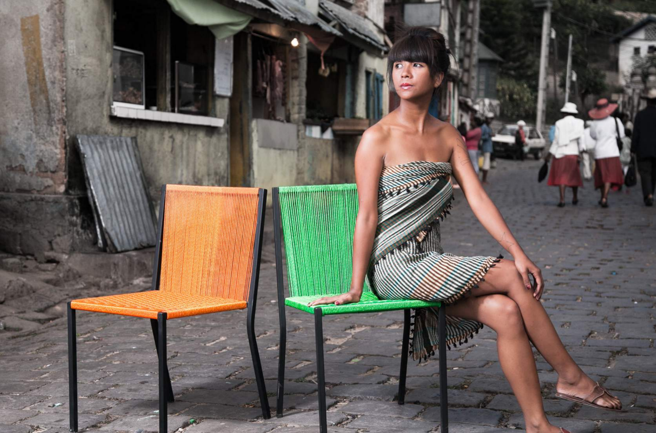
LIGNE HYBRIDE TADY