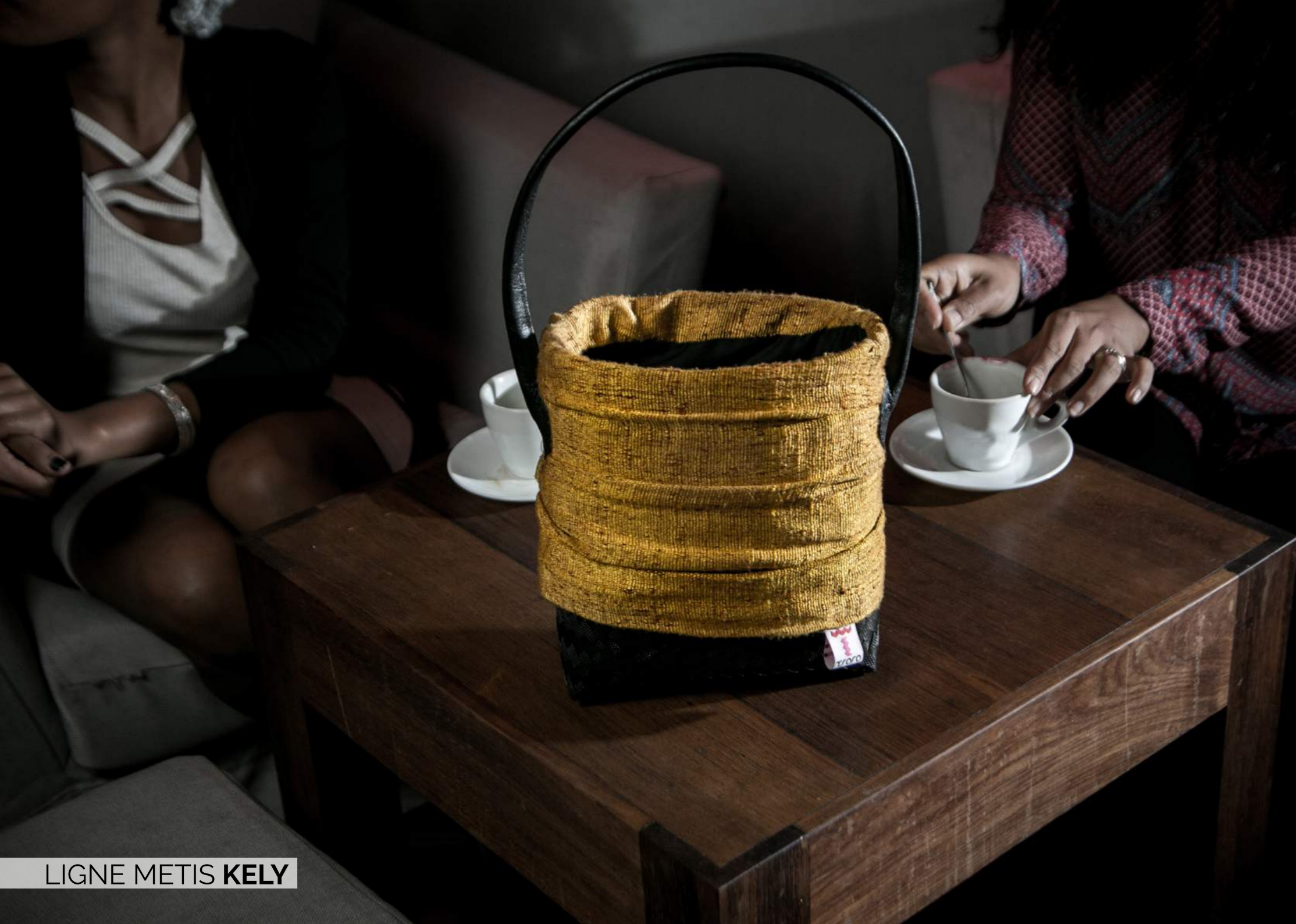
LIGNE METIS KELY