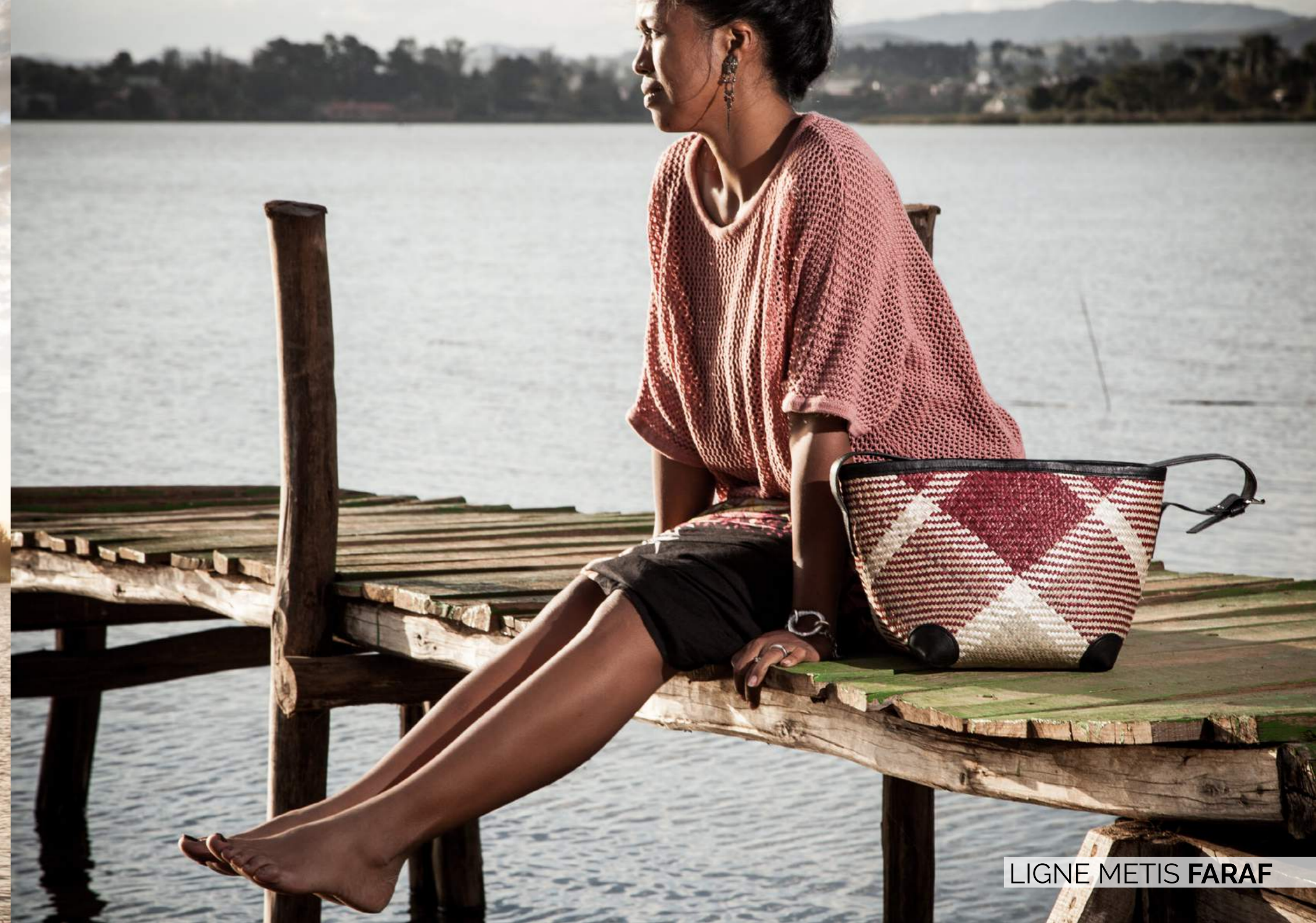
LIGNE METIS FARAF