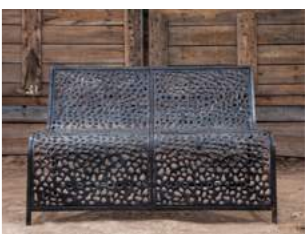
M L 120 x P 80 x H 80 x A 44 cm