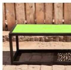
G L 120 x P 40 x H 40