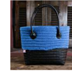
B L 44 x P 13 x H 31 cm