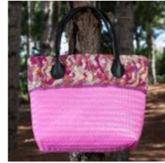
Pk L 44 x P 13 x H 31 cm