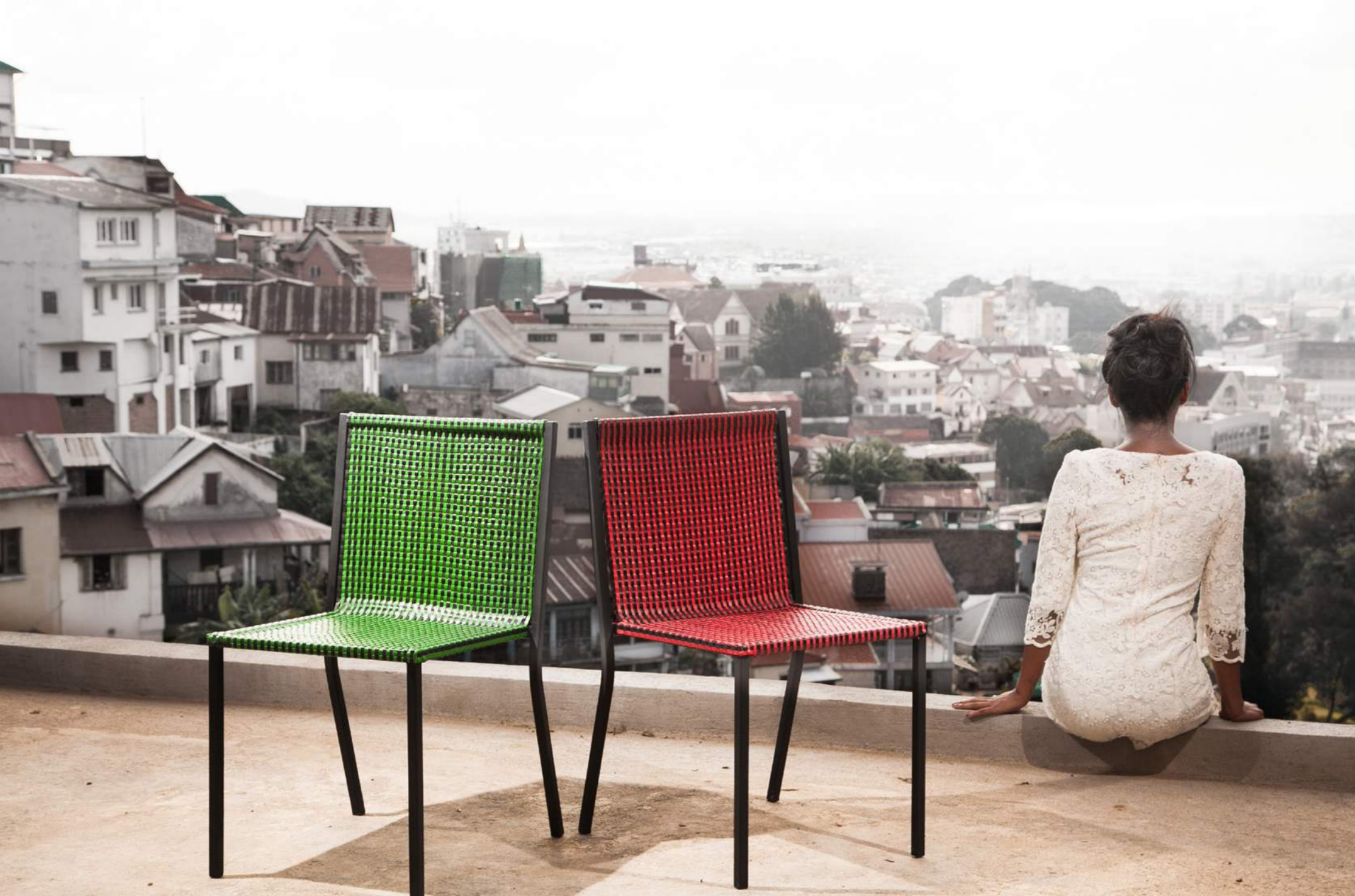
LIGNE HYBRIDE TSIRY