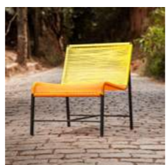
Y/O L 62 x P 72 x H 72 x A 37 cm