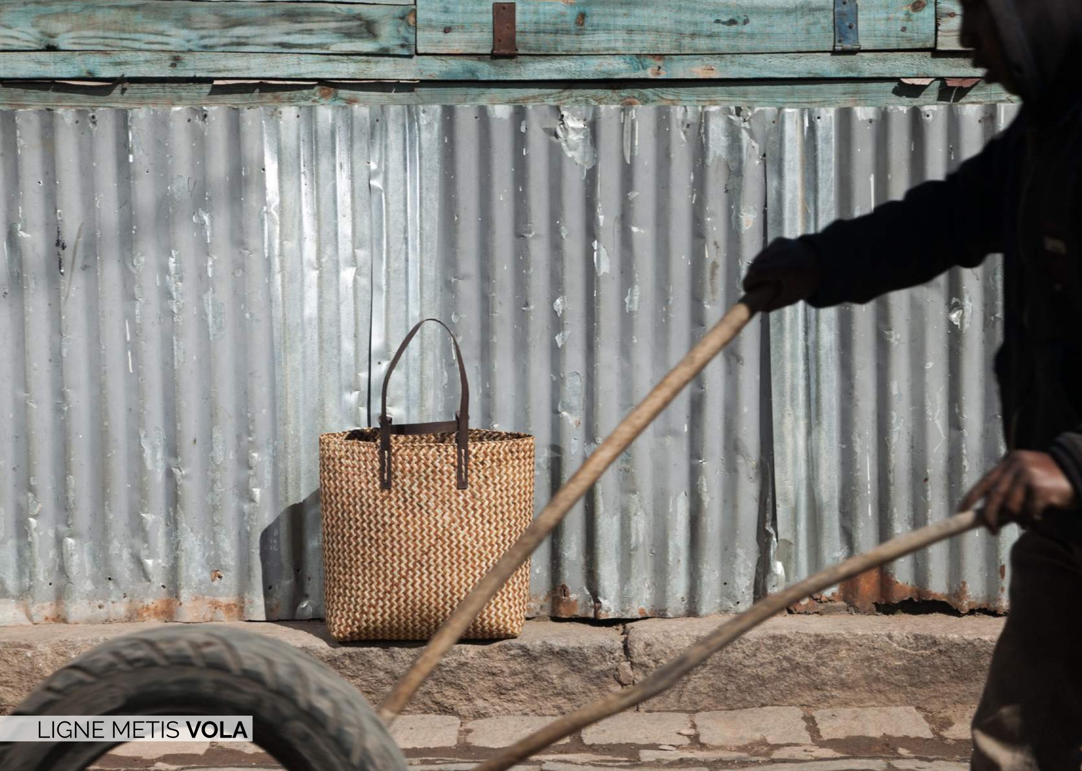
LIGNE METIS VOLA