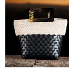
L 35 x P 9 x H 25 cm