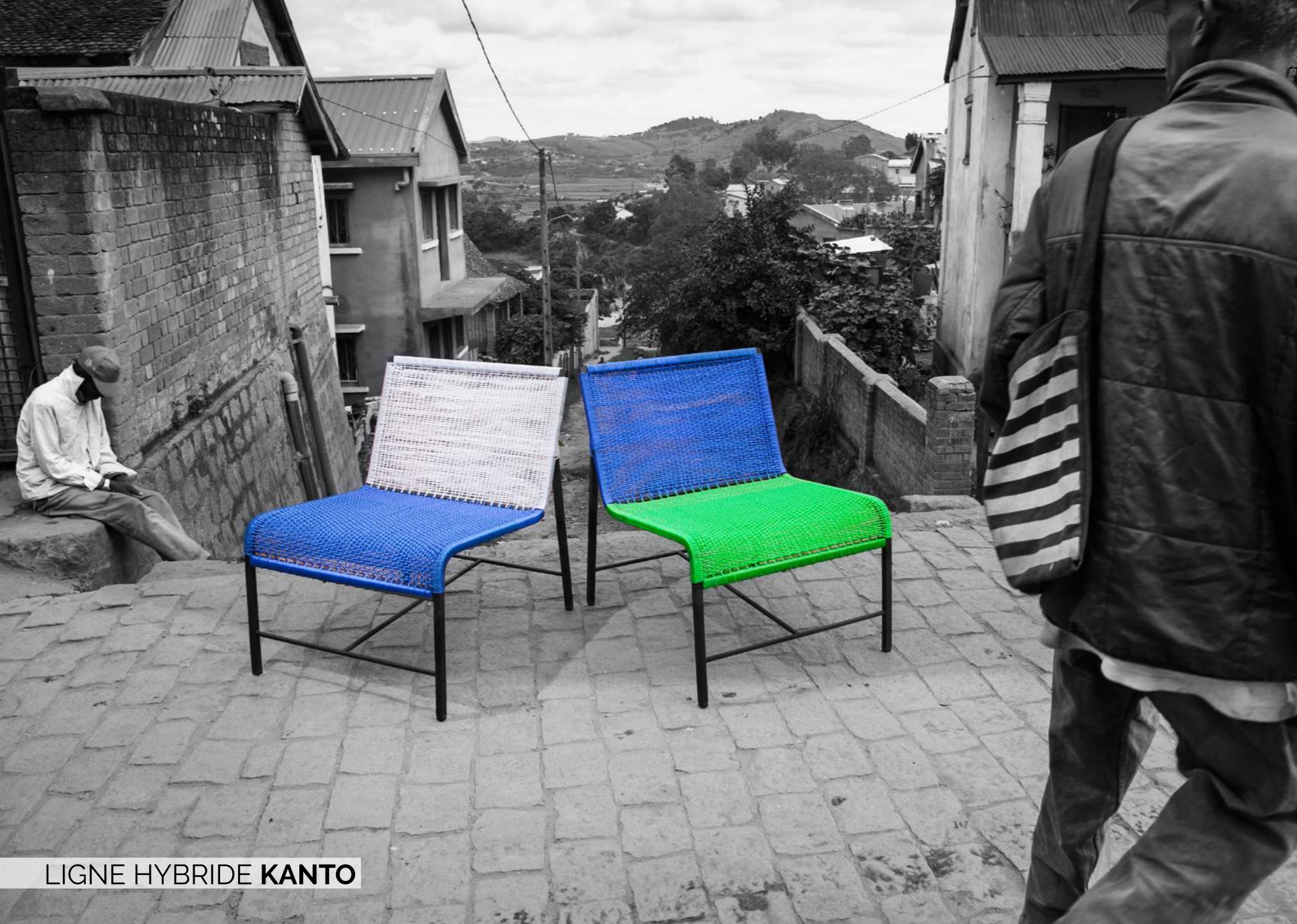
LIGNE HYBRIDE KANTO