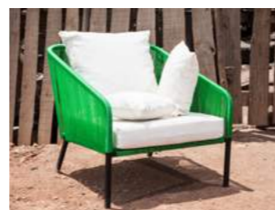
R O G B L 83 x P 90 x H 80 x A 43 cm