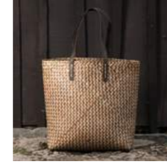
L 44 x P 12 x H 36 cm