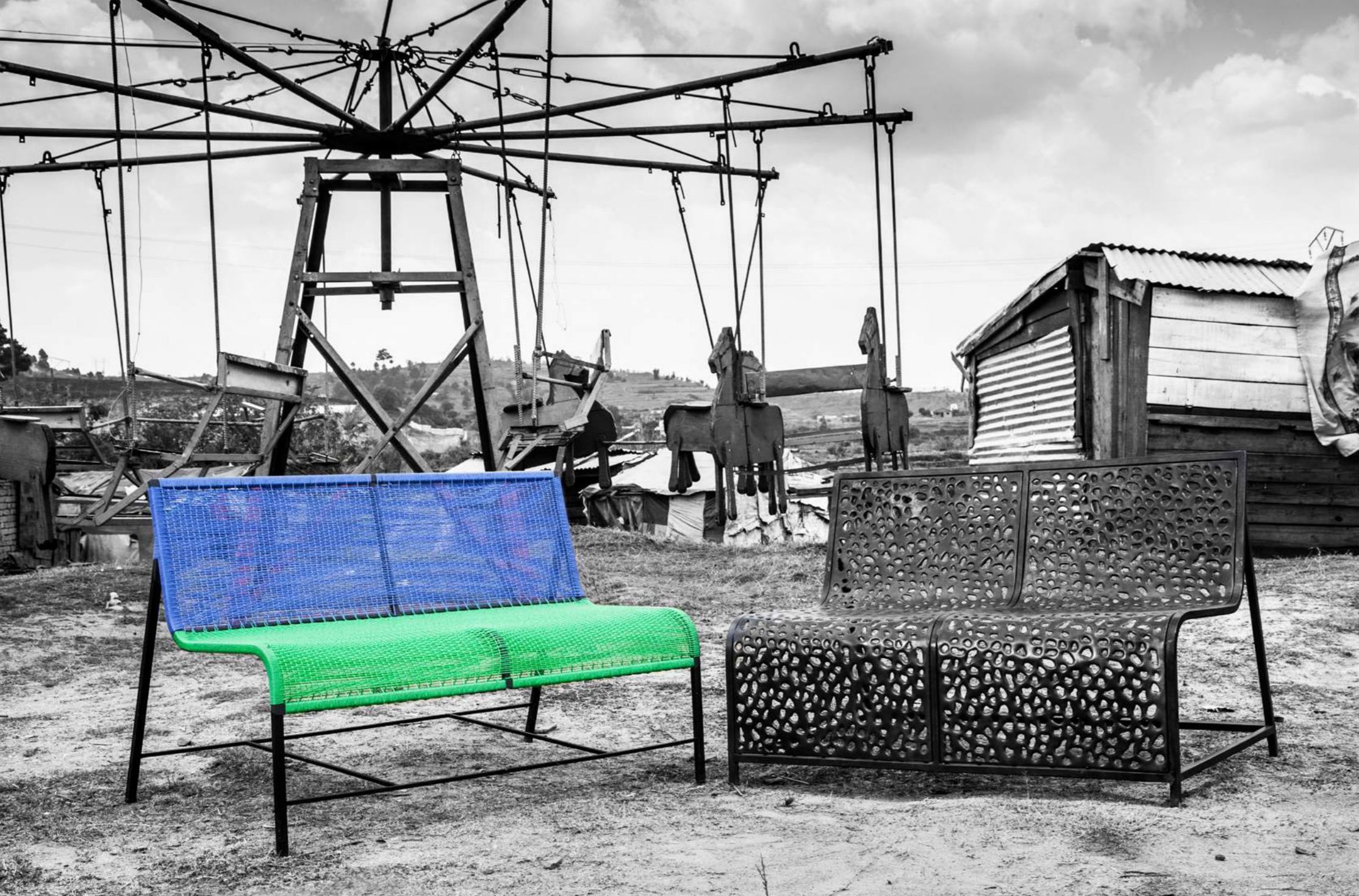
LIGNE HYBRIDE TOBE / LIGNE VOLCANIC VATO