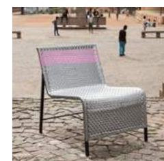
S L 63 x P 75 x H 75 x A 37 cm