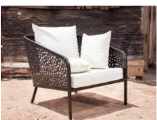
M L 83 x P 90 x H 80 x A 43 cm