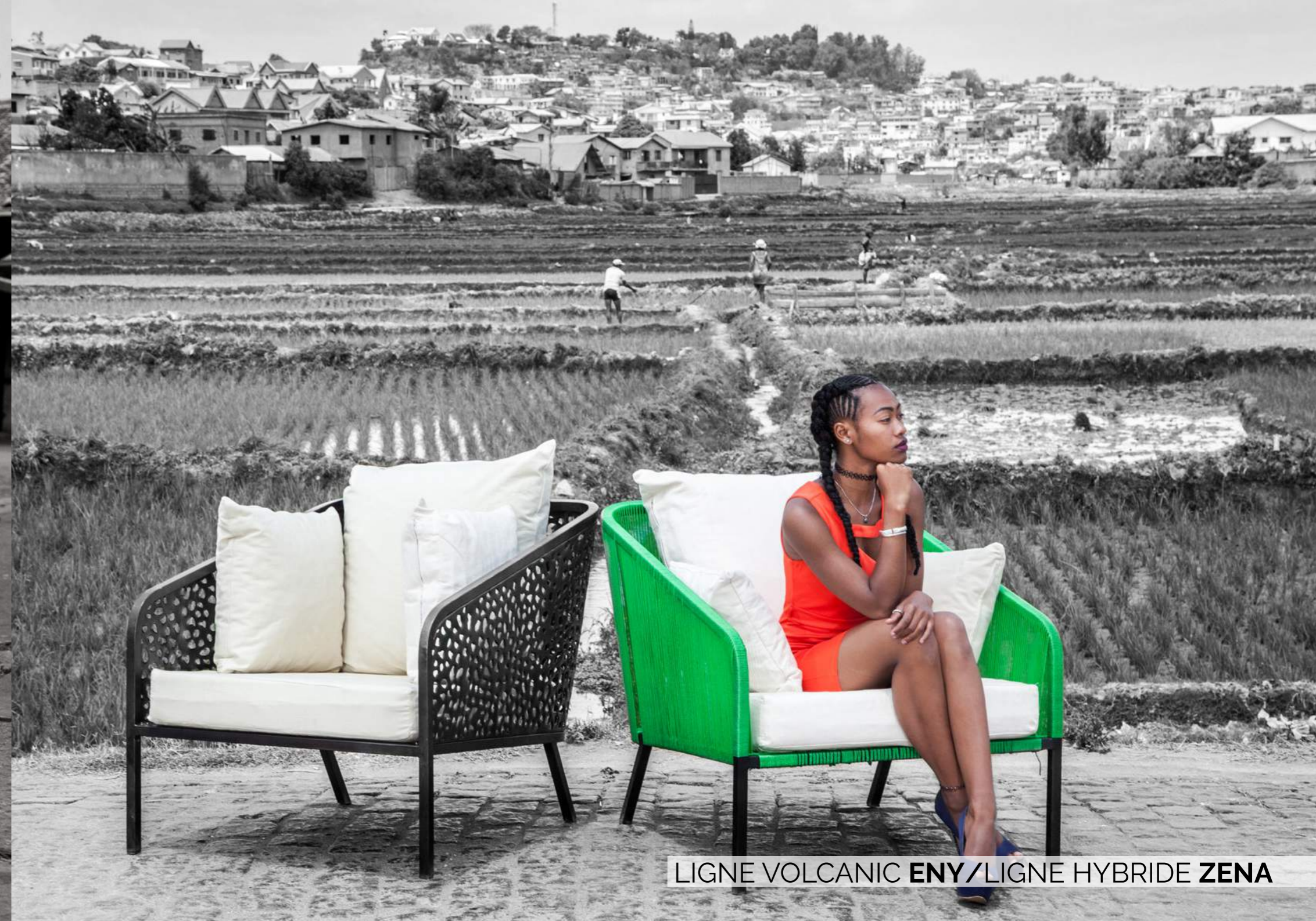
LIGNE VOLCANIC ENY/LIGNE HYBRIDE ZENA