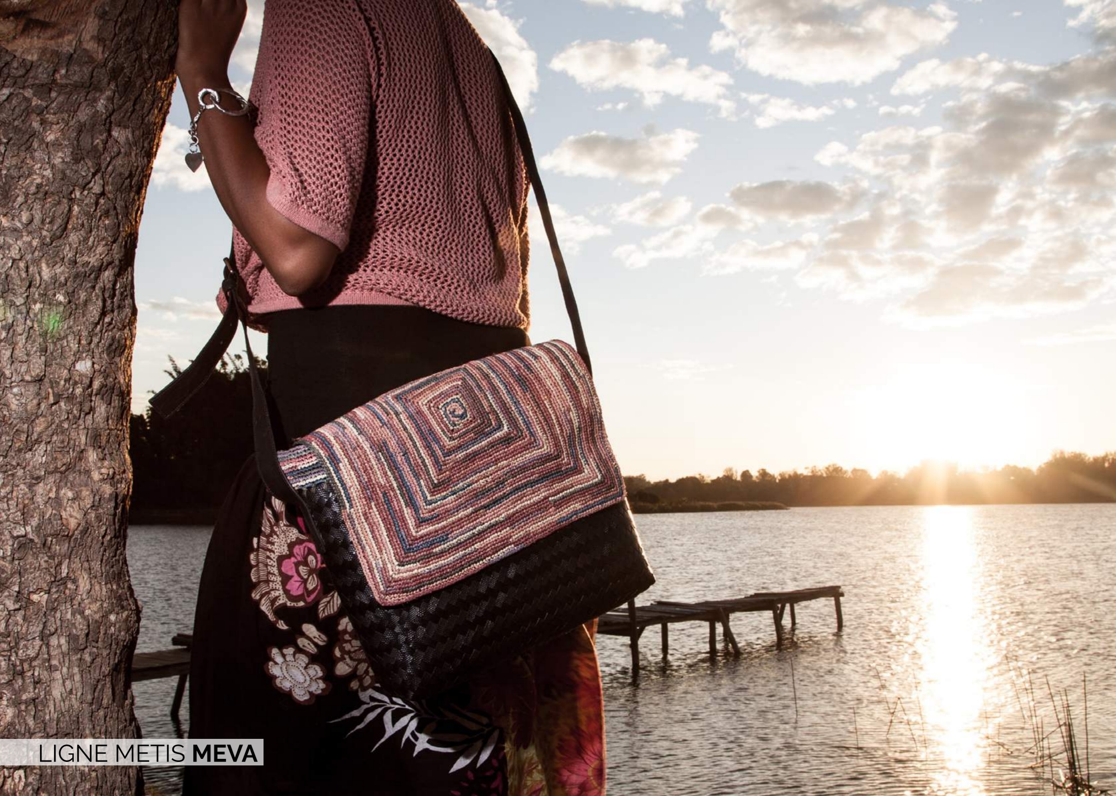
LIGNE METIS MEVA