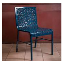
G L 45 x P 55 x H 83 x A 45 cm