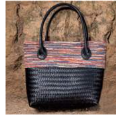
Mc L 44 x P 13 x H 31 cm