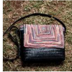
Mc L 35 x P 7 x H 27 cm