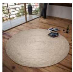
Ø 1 - 2 - 3 m