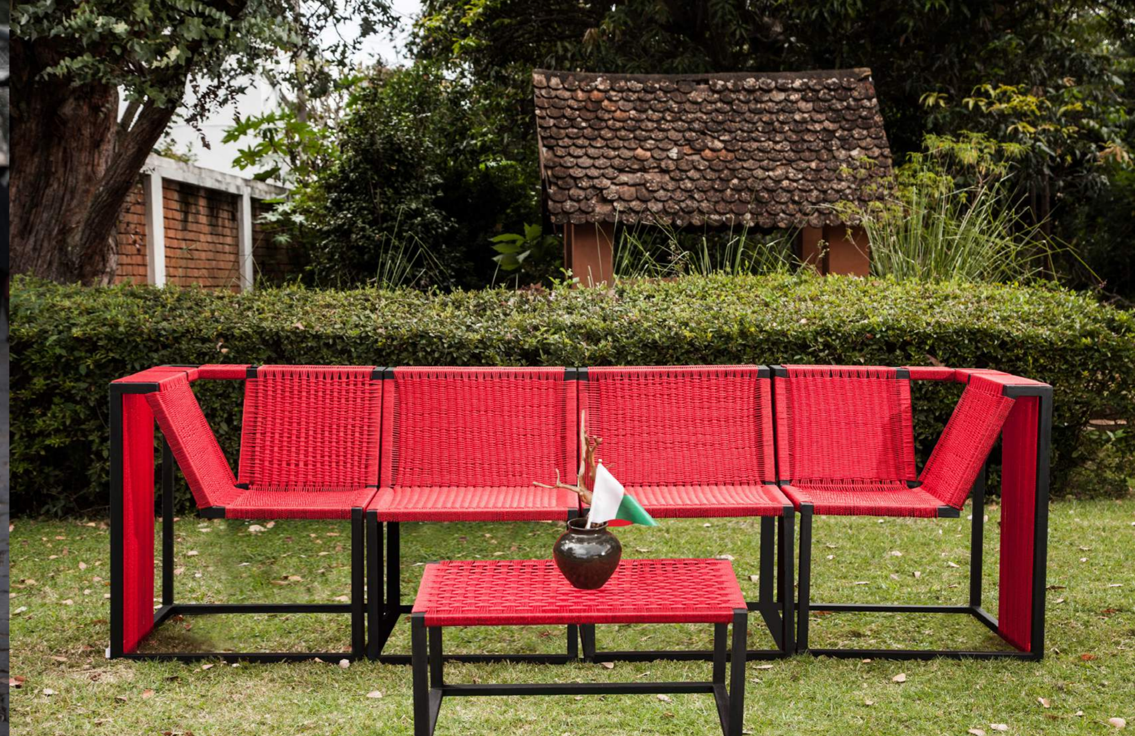
LIGNE HYBRIDE KAZO