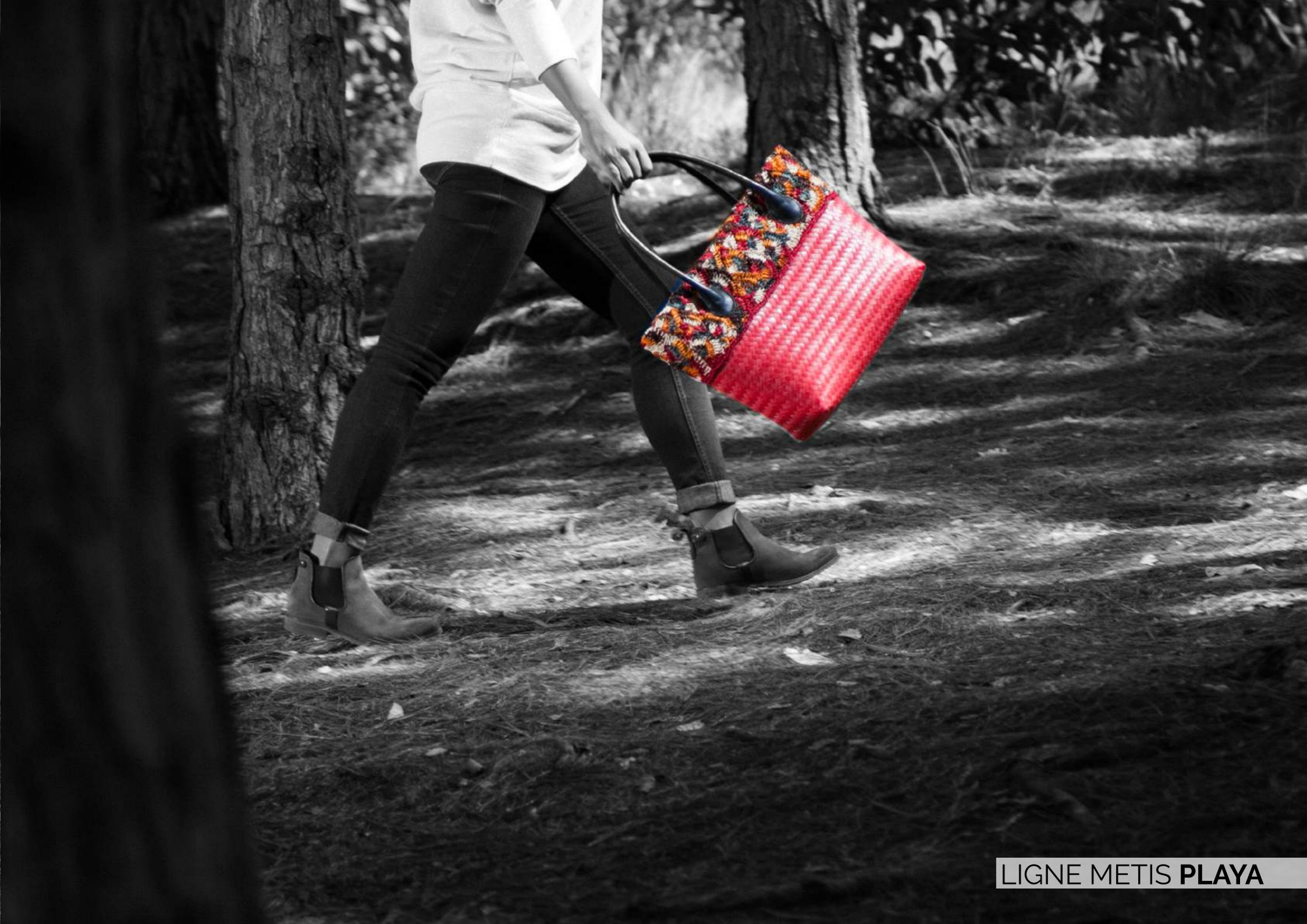
LIGNE METIS PLAYA