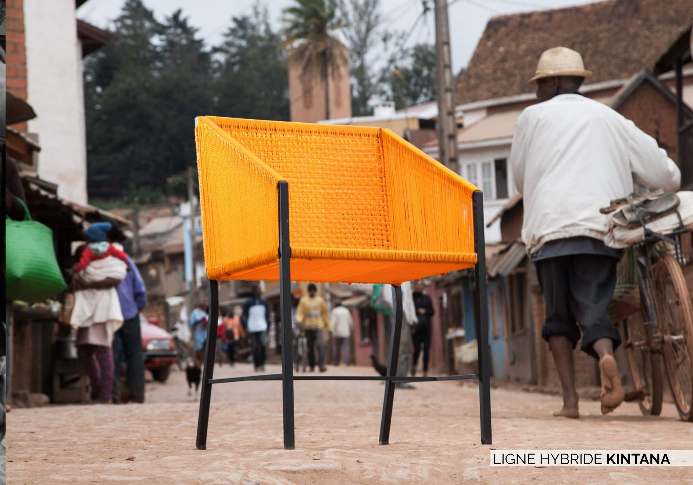
LIGNE HYBRIDE KINTANA