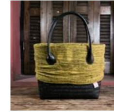
A L 44 x P 13 x H 31 cm