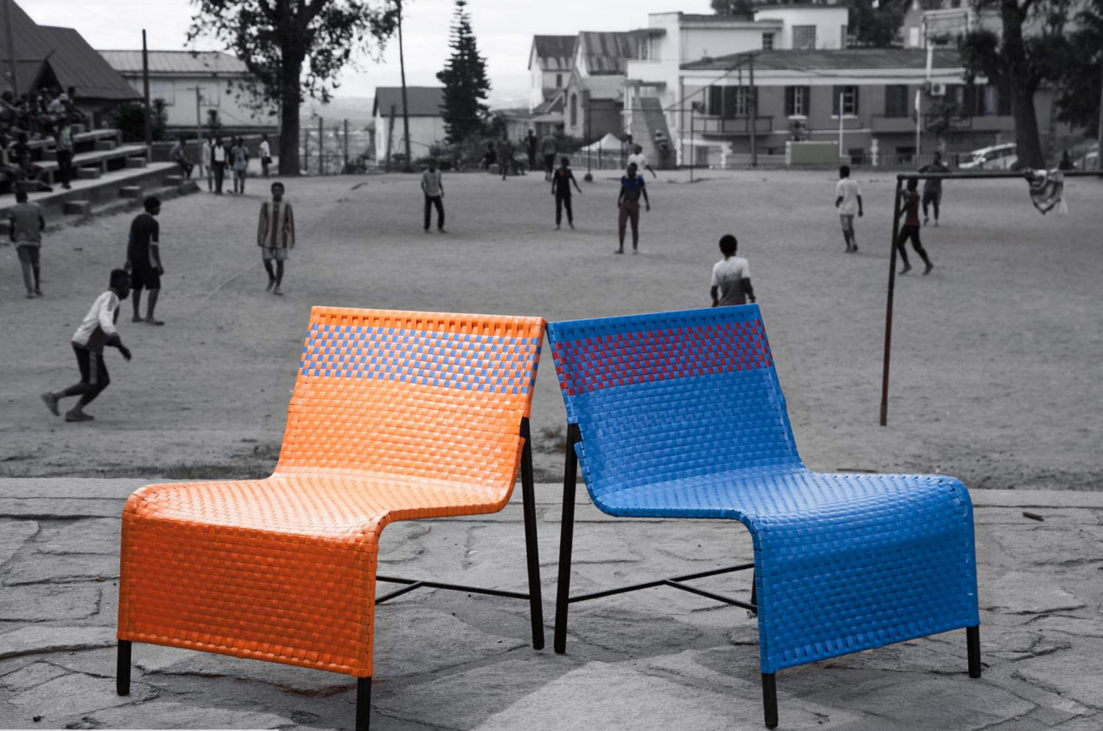
LIGNE HYBRIDE ARIS