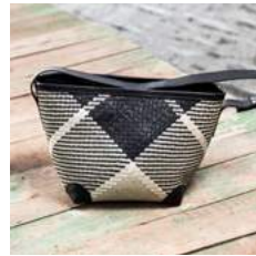
Bl L 40 x P 20 x H 23 cm