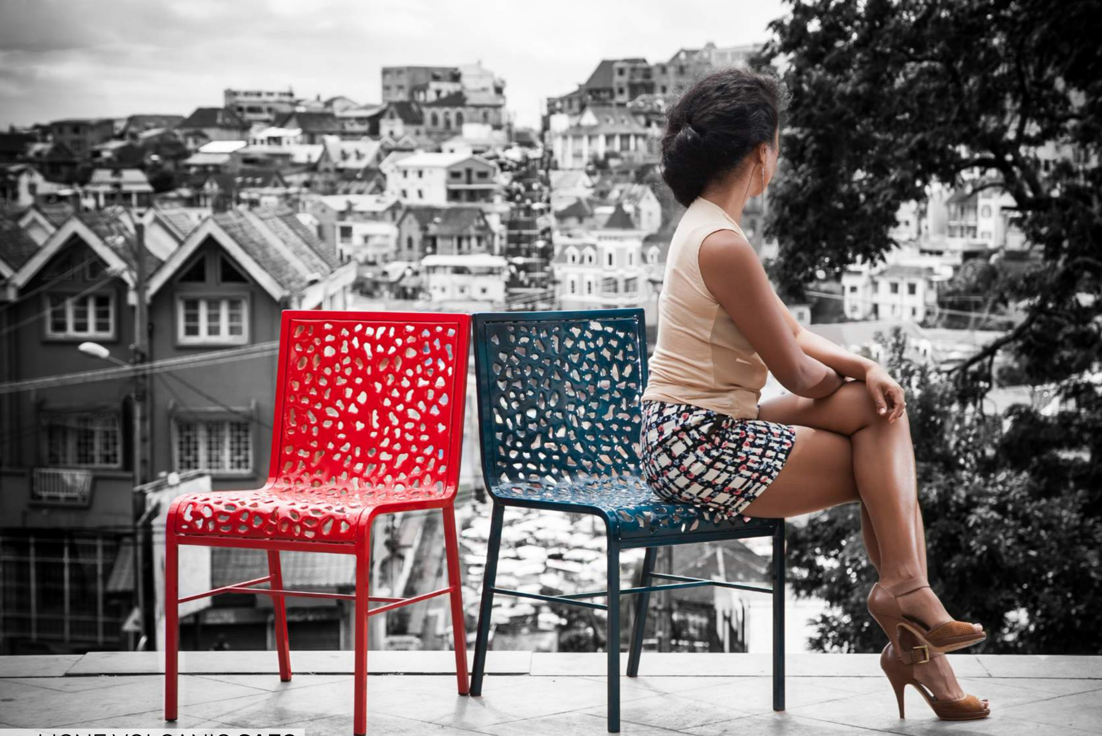
LIGNE VOLCANIC SAFO