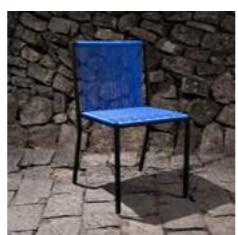
B L 45 x P 54 x H 83 x A 46 cm