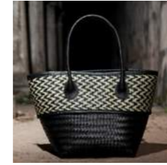
L 45 x P 24 x H 29 cm