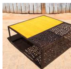
O L 100 x P 100 x H 40 L 120 x P 120 x H 40