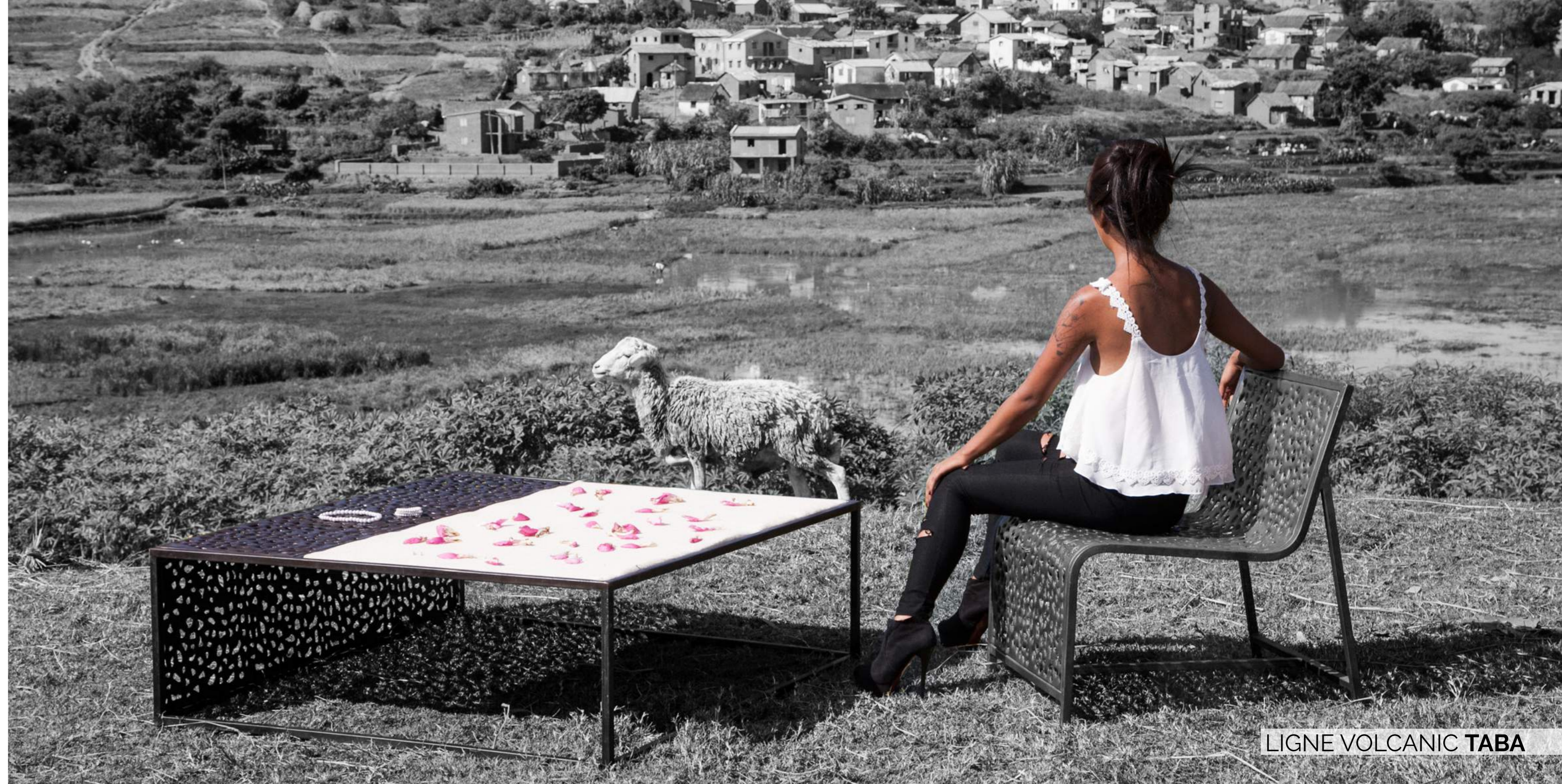
LIGNE VOLCANIC TABA