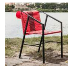
R L 49 x P 64 x H 82 x A 47 cm