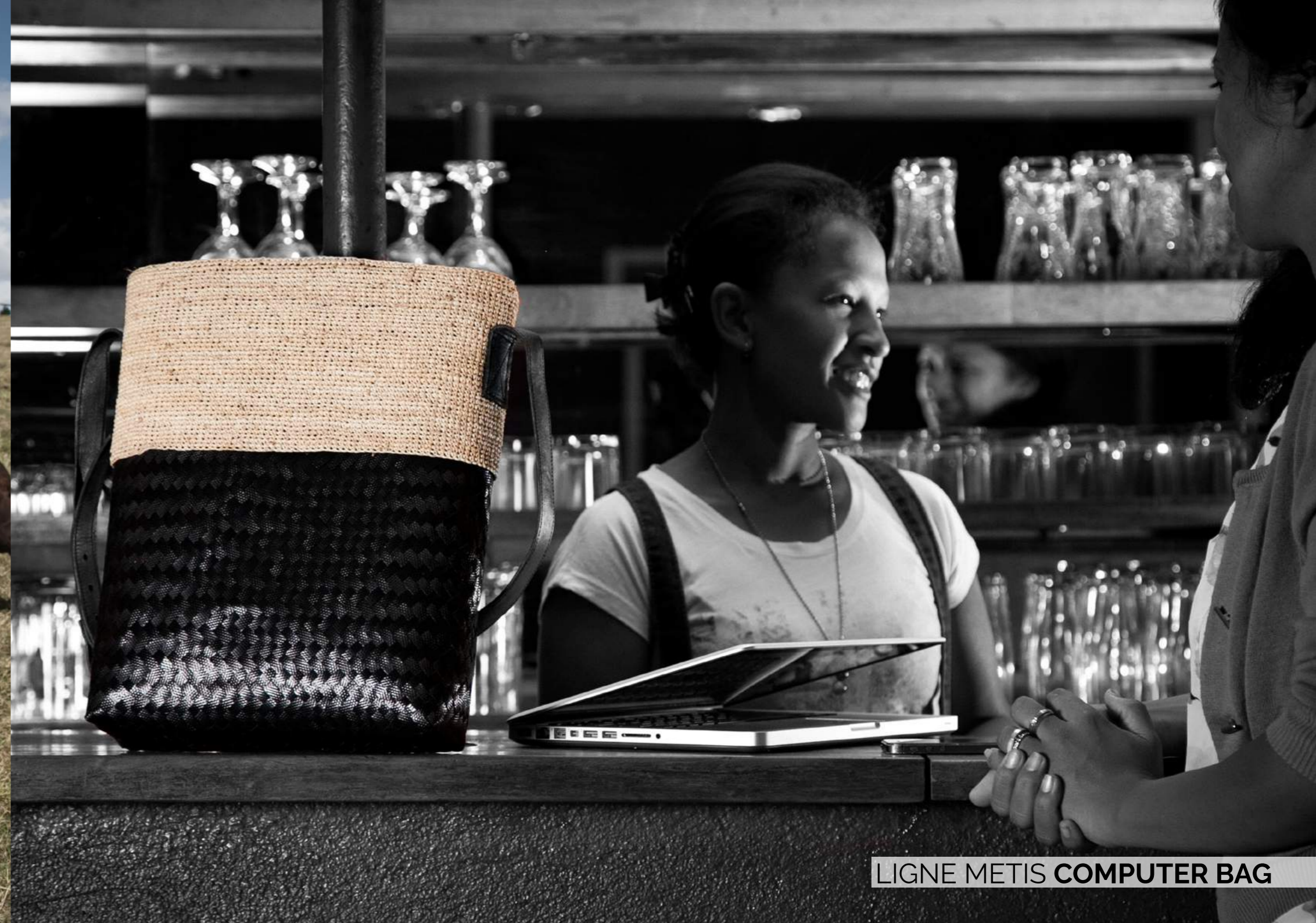
LIGNE METIS COMPUTER BAG