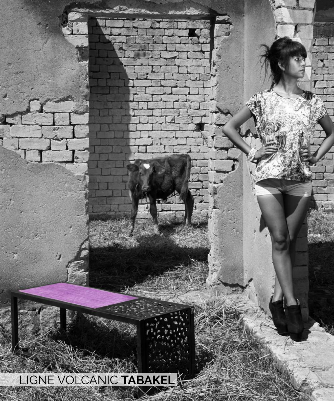
LIGNE VOLCANIC TABAKEL