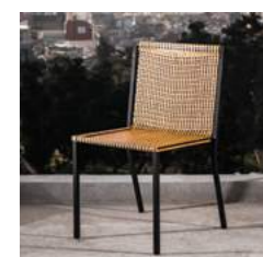
O L 45 x P 54 x H 83 x A 46 cm