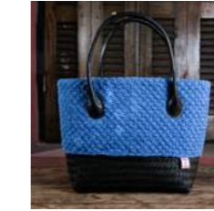
B L 44 x P 13 x H 31 cm