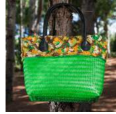
G L 44 x P 13 x H 31 cm