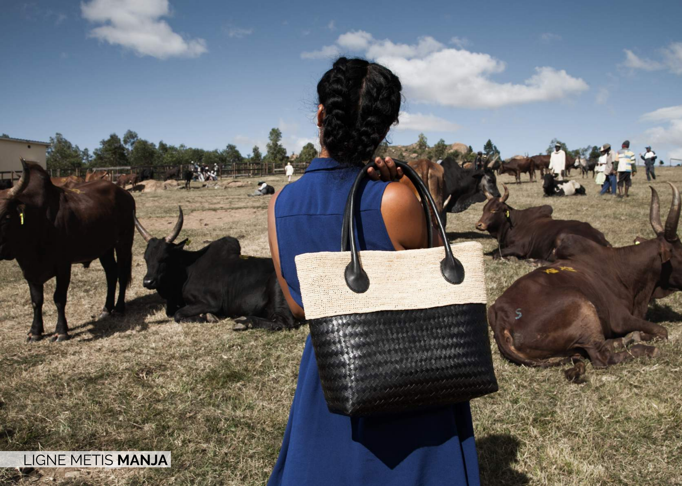
LIGNE METIS MANJA