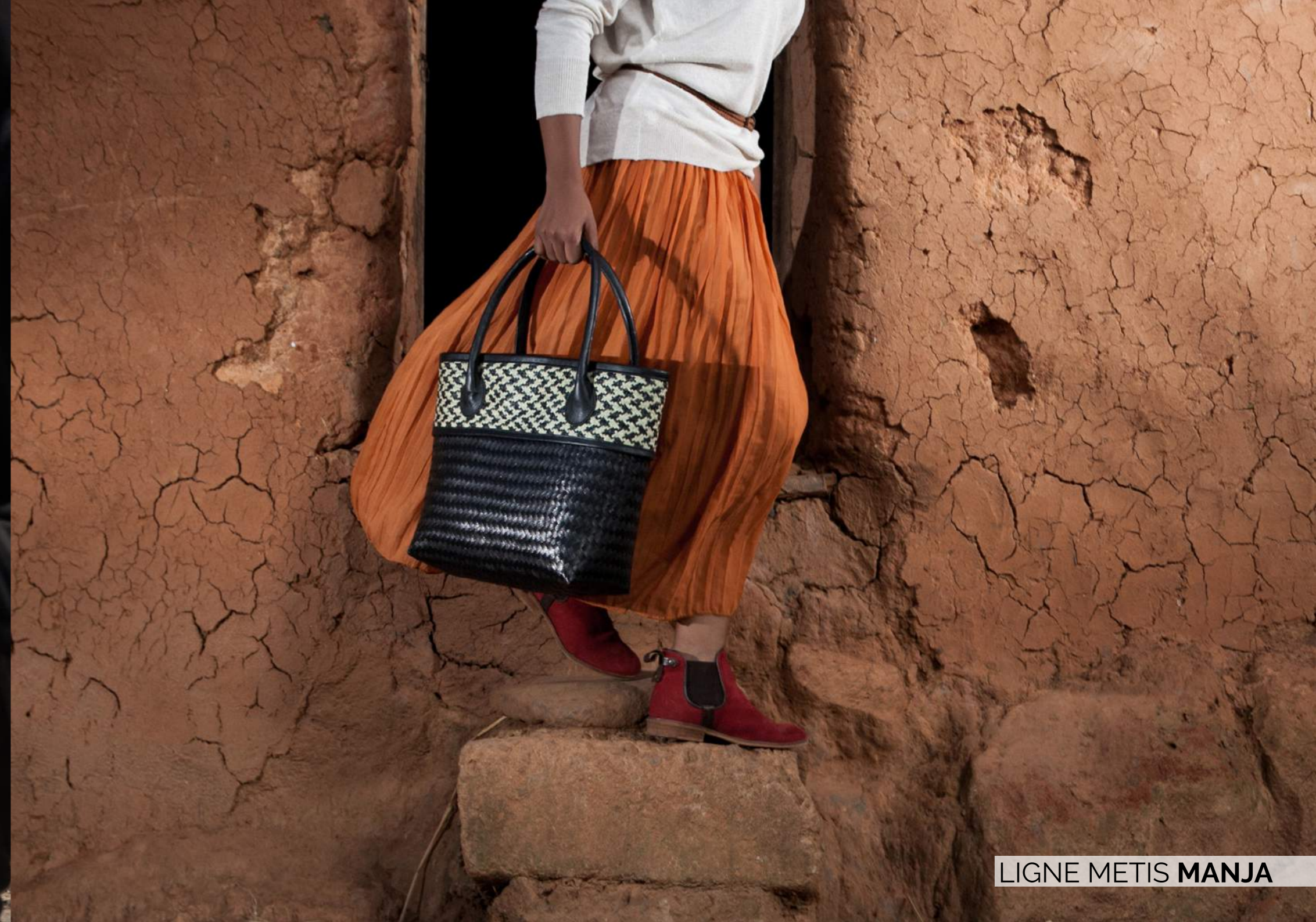
LIGNE METIS MANJA