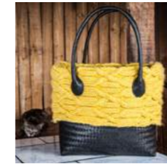
A L 44 x P 13 x H 31 cm