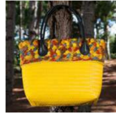
Y L 44 x P 13 x H 31 cm