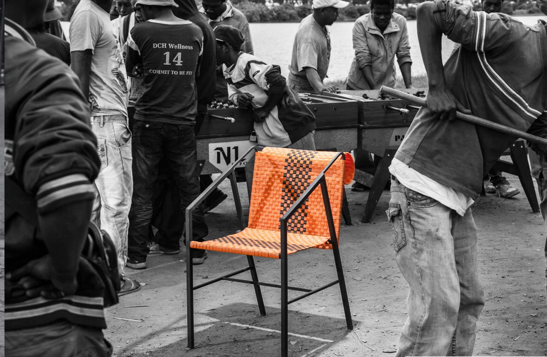
LIGNE HYBRIDE ZUCO