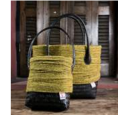
A L 20 x P 7 x H 43