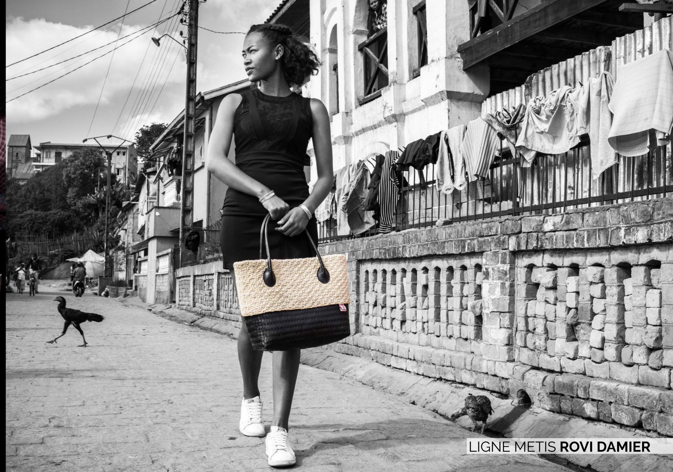
LIGNE METIS ROVI DAMIER