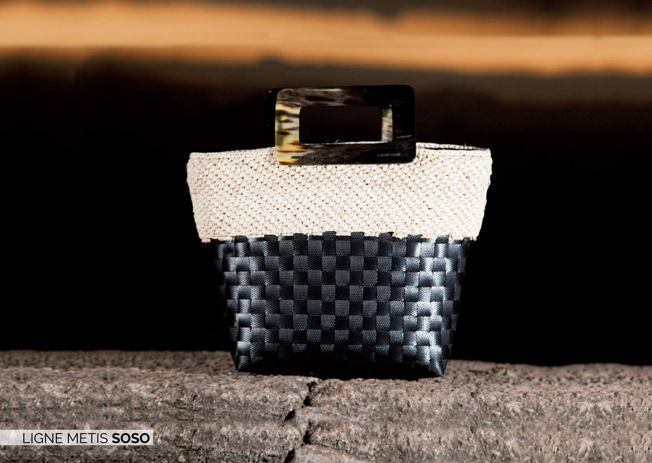
LIGNE METIS SOSO