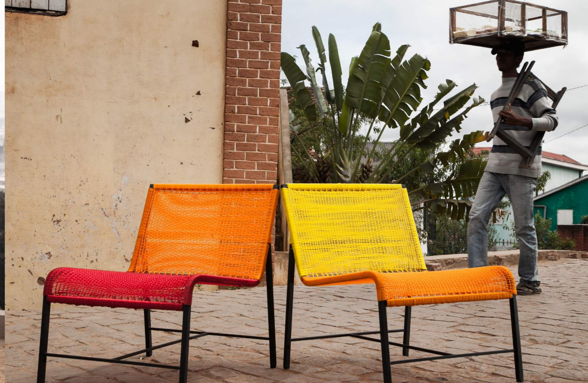
LIGNE HYBRIDE KANTO