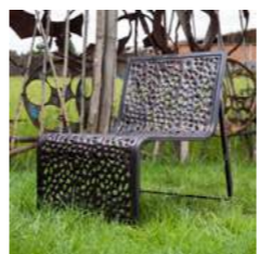
M L 60 x P 72 x H 76 x A 38 cm